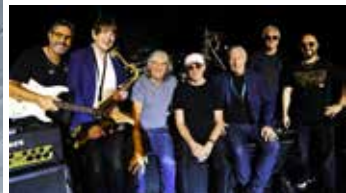
Dire Straits Legacy, plus Deacon Blues