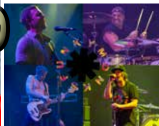
Funky Monks, plus Ixnay