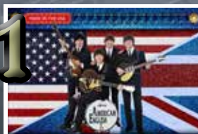
American English, plus Mac Attack