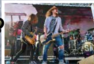
Soul Asylum, plus Stone Type Thing