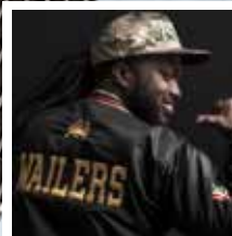
The Wailers, plus Santeria