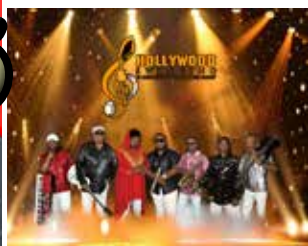
Hollywood Swinging, plus Superfly Symphony