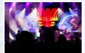
Lateralus, plus The Buzz Worthys