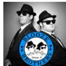
Blooze Brothers, plus Bonnie 'N the Boyz