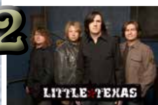
Little Texas, plus Nashville Electric