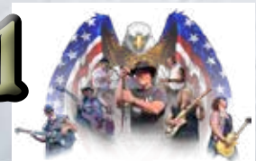
Freebyrd, plus The Wild