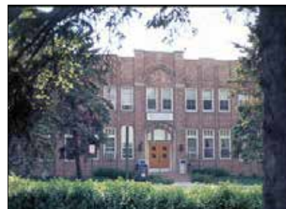
Edificio Municipal de Addison, el antiguo Kinderheim, antes de que se cambiara la dirección a 131 W. Lake St.

El antiguo gimnasio se utilizaba regularmente para espectáculos, concursos, reuniones y eventos cívicos y deportivos. Fue utilizado por las escuelas públicas, la Escuela Luterana St. Paul, el Club Recreativo de Addison, grupos de scouts y asociaciones de propietarios.