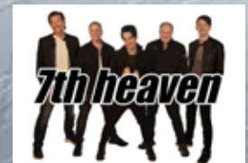
7th Heaven, plus Strung Out Fireworks Finale